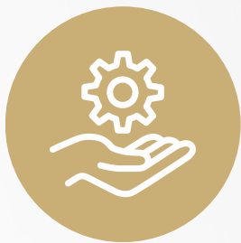
TABELA SERVIÇOS EXTRA